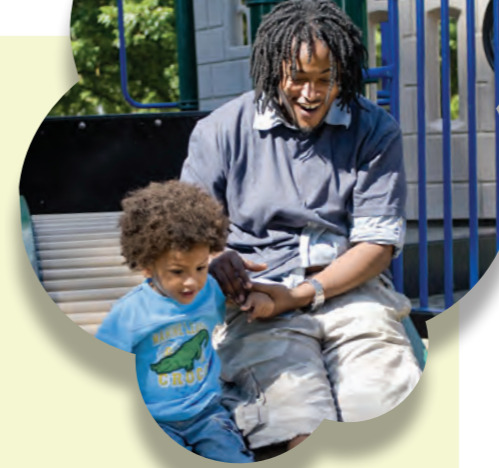
Waxaan jeclahay in aan cayaaro maalin kasta.