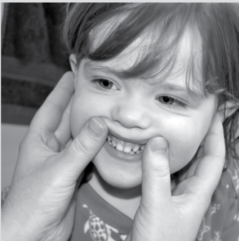
Levanta mis labios y busca manchas en mis dientes.

Si su niño aún no ha tenido su primera revisión dental, ahora es momento de hacerlo. Llame al dentista de su niño para hacer una cita. Para recibir ayuda para encontrar un dentista llame a la línea de ayuda Family Health al 1-800-322-2588 o visite helpmegrowwa.org/es/