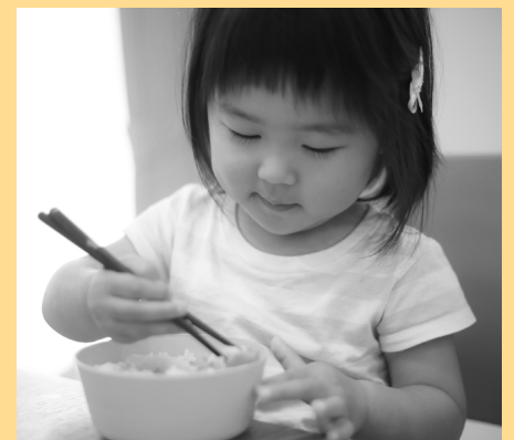
Come conmigo y ofrézame algo de cada grupo de alimentos.

Para obtener más información o recursos sobre nutrición en doh.wa.gov/YouandYourFamily/WICenEspañol .