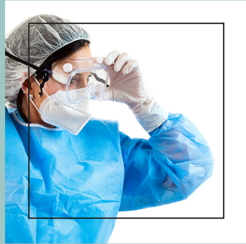
VISITA DE AISLAMIENTO: precauciones sobre el aislamiento para la LTC