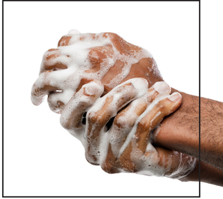
VISITA GENERAL: visita de LTC

Escanee uno de los siguientes códigos QR y mire un breve video . Infórmese sobre el impacto de las medidas básicas para prevenir infecciones en las comunidades que reciben LTC (por su sigla en inglés, atención a largo plazo).