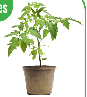
PLANTINES (A PARTIR DE LOS CUALES SE PRODUCEN ALIMENTOS)