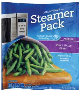
PAPAS O VERDURAS SIN OTROS ADITIVOS