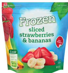
FRESAS Y BANANAS CONGELADAS SIN SIROPE