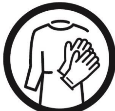
ጋዎንና ጓንት ያድርጉ