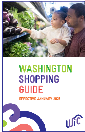
ኦዲስ የግብይት መመሪያ