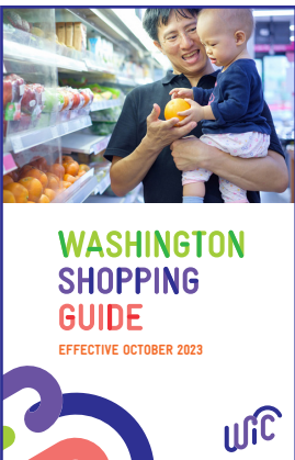
ဈေးဝယ် လမ်းညွှန်အဟောင်း