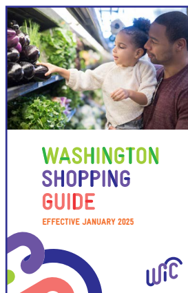
NUEVA GUÍA DE COMPRAS

Utilice esta guía para obtener más información sobre las actualizaciones de nuestros alimentos aprobados por WIC.