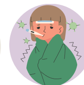
免疫系统较弱的人