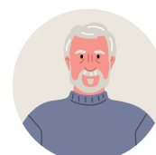
Mga Nakatatanda (65+ taon)