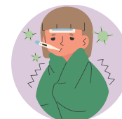
May Mahihinang Immune System