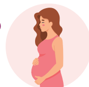
Mga Indibidwal na Buntis

May ilang taong mas posibleng magkaroon ng malulubhang komplikasyon sa pagkakasakit mula sa pagkain. Ang mga taong lalo nang nanganganib na magkasakit ay hinihikayat na piliin ang mga pagkaing lutong-luto.