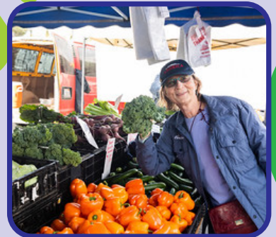
လယ်သမားဈေးတွင် အသစ်တစ်ခုခုကို စမ်းဝယ်ကြည့်ပါ။