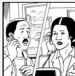
قبل از مراجعه به داکتر تماس بگیریید.