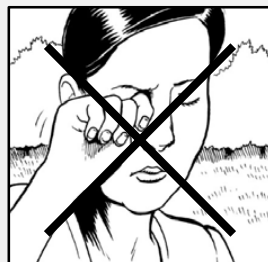
به دهن، بینی یا چشمان تان دست نزنید.