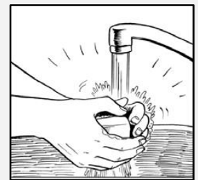
دستان تان را بشویید.