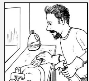
سطوح را در خانه تان پاک کنید.