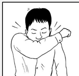
سرفه و عطسه تان را بپوشانید.

برای نگرانی های مرتبط به کووید-19 با فراهم کننده خدمات صحی تان به تماس شوید.