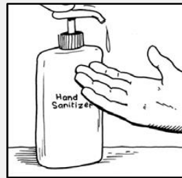
از مایع ضدعفونی استفاده کنید.