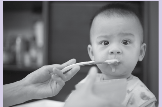
Déjame probar pedacitos de comida suave o hecha puré.

Para más información, consulte el folleto "Alimentando a su bebé de los 6 a 12 meses" en este envío. Si tiene preguntas sobre alergias alimentarias, hable con el médico de su bebé o con WIC.